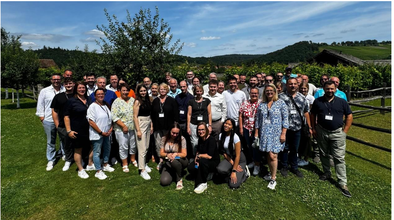
Die Delegierten des Landesgewerkschaftstages 2024

Den ausführlichen Bericht zum Landesgewerkschaftstag und viele Bilder gibt es hier .